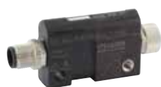
IO-Link Analog Adapter