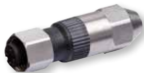
V2A M12 Mosa mit Schneidklemmtechnik