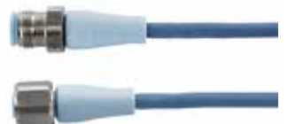
M12 F&B PP Line in Hygienic Design