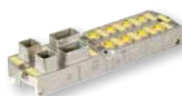
MVK Metall Safety