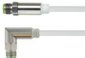
M12-V4A-Steckverbinder, gerade und gewinkelt